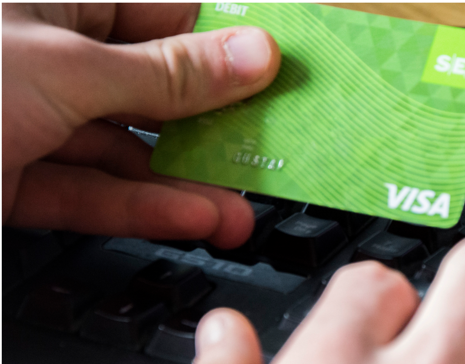
E-handeln ökar stort i Sverige, men det orsakar också flera konkurser på olika företag som i sin tur leder till ökat arbetslöshet. OBS! Bilden är redigerad.

Även Media Markt i Kalmar har visat i sina senaste årsredovisningar en tydlig förlust de senaste åren. Företagets egna